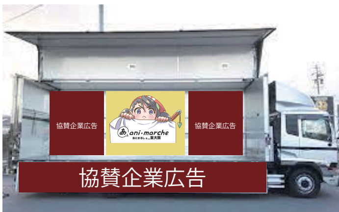
当日トラック展開イメージ図