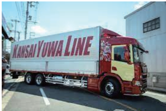
ステージ用トラック（株式会社優輪商事協力）